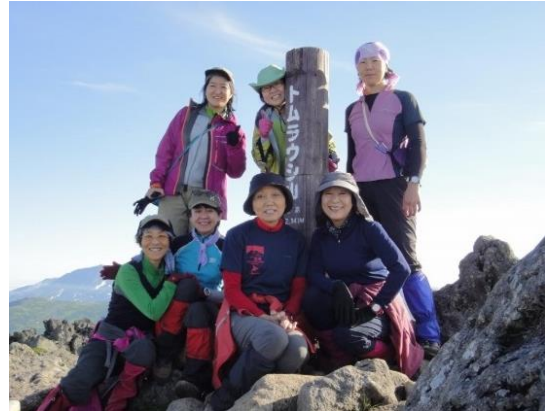
快晴のトムラウシ山山頂

2日目はトムラウシ山の頂上を踏み、その後双子池キャンプ地迄の12kmの行程。朝起きると快晴。朝食を済ませ青空の中を一気に山頂へ。頂上からは360度の展望、青空と真っ白な雲海から頭を出している大雪山系や十勝山系の山々に感動。これから進むオプタテシケ山の雄姿やそこに続く稜線も見え、今日一日の行動に意欲が湧く。下山後テントを撤収して出発。急斜面を下って行くと、南沼のエメラルドグリーンの輝きに癒される。そこから平坦な道を進むと黄金ヶ原につく。イワイチョウは見られなかったが、チングルマの花畑だった。三川台あたりから先の稜線は、十勝側から上川方面に稜線を越えて流れていく雲で展望がきかなくなる。ツリガネ山・コスマヌプリ頂上は巻いて通過。兜岩を過ぎてあとは本日の幕営地、双子池に向かってひたすら歩き、出発から8時間で到着する。