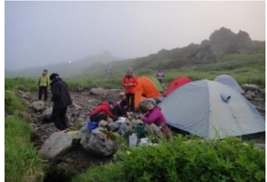
トムラ南沼野営指定地

1 日目は 9 : 50 登山口を出発、重いザックにあつという間に汗が吹き出します。しかしそこはパワフルレディー、全員分の美味しい煮玉子などが個人のザックから出てきてふるまわれま す。短く休憩しつつコマドリ沢に到着したのが 13 : 25。さすが三連休のトムラウシ、雪渓を尻滑りして楽しんだ女子大生など、たくさんの登山者がいました。今にもハイジが出てきそうな お花畑の連続で花に励まされながら、16 : 20 南沼 キャンプ地に到着。ガスがかかって肌寒いテント場 は、すでに一杯でした。なんとか二張りして夕食は 手巻き寿しとマーボー春雨！ 本当に美味しかった！ そうこうしているうちにガスが晴れ、トムラウシの 山頂が姿を見せました。トムラウシ山は私にとって 「いつか力量がいたら挑戦しよう」と考えていた 山でした。そのトムラウシ山に明日行けるんだと思 うとうれしい思いが込み上げてきました。