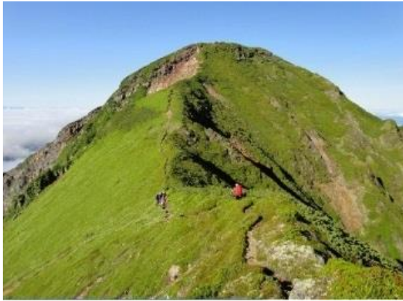
オプタテシケ山山頂直下を行く

先頭から順番にケルンを積んでいき、崩した人が下山後に皆に炭酸をおごるというもの。わざと次の人に難しい石を選んでみたりするうちに、盛り上がり疲れを忘れて山頂に到着(7:15)していました。山頂で朝食です。アルファ米と昆布の佃煮、梅干しをバリバリの海苔に巻いてお