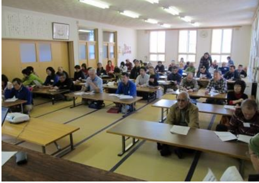
指導委員会全体会議