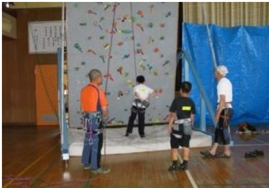
クライミング体験