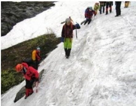
急な斜面での歩行訓練

二日目は、9時より雪溪の残る十勝岳望岳台の沢において雪上訓練が行われ、雪の斜面を登山靴のみで歩行する訓練や、上り下がりピッケル使用や急斜面でのアイゼン装着の注意、歩き方のほか、滑落停止などを実践した。また、転倒しないよう歩くことの重要性も学習しました。