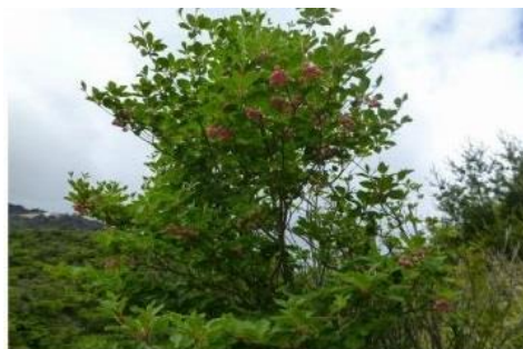
サラサドウダンの大木

今年はツツジの開花が早かったと聞いていたため「花は終わっているのでは？」と心配でしたが、サラサドウダンの大木は見事な花を見せてくれました。また、山肌一面に咲くエゾイソツツジの群生も圧巻でした。