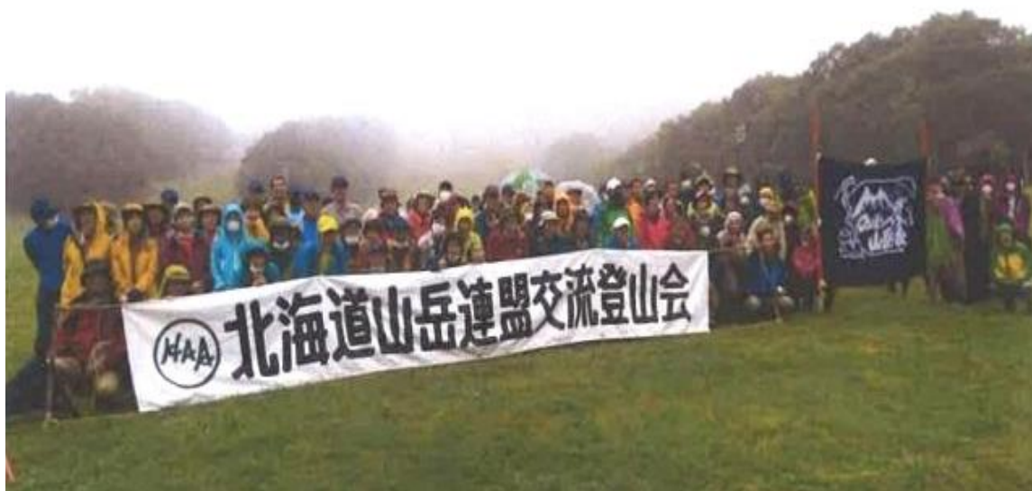
カルルス温泉サンライバスキー場での開会式

登山コースはAコース 来馬岳カルルス温泉コース、Bコース 来馬岳オロフレ峠コース、Cコース オロフレ山、Dコース 橘湖。